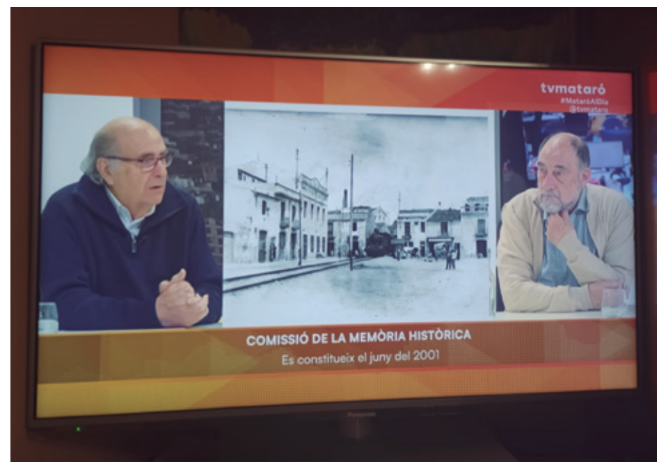
LA COMISSIÓ A TV MATARÓ

També hem participat en tertúlies i programes de debat, en què s'ha pogut explicar la nostra tasca en l'àmbit de la memòria històrica i compartir-la amb un públic més ampli. A més, fem una important tasca de difusió a través de les xarxes socials i altres canals digitals del servei d'Igualtat i Diversitat Ciutadana de l'Ajuntament de Mataró, amb el qual compartim activitats, projectes i continguts per arribar a més persones i mantenir informada la ciutadania. Aquesta presència als mitjans i a les xarxes ha ajudat a donar visibilitat a la feina de la Comissió i a fer-la més accessible.