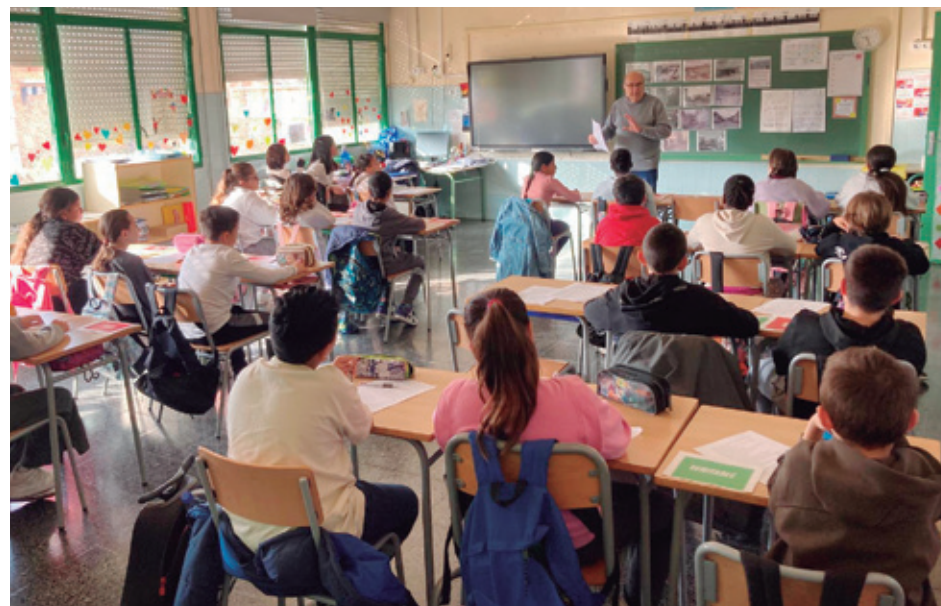
UN MEMBRE DE LA COMISSIÓ EN UNA ESCOLA DE MATARÓ

Aquestes iniciatives fomenten un aprenentatge viu i proper, que connecta els continguts de diverses assignatures amb experiències reals. Alhora, afavoreixen el diàleg entre generacions, promovent valors com el respecte, l'empatia i la comprensió del passat, per entendre millor el present. La participació activa dels joves en la recuperació de la memòria col·lectiva contribueix també a reforçar el sentiment de pertinença i identitat local, convertint aquest intercanvi en una experiència enriquidora per a tota la comunitat educativa i social.