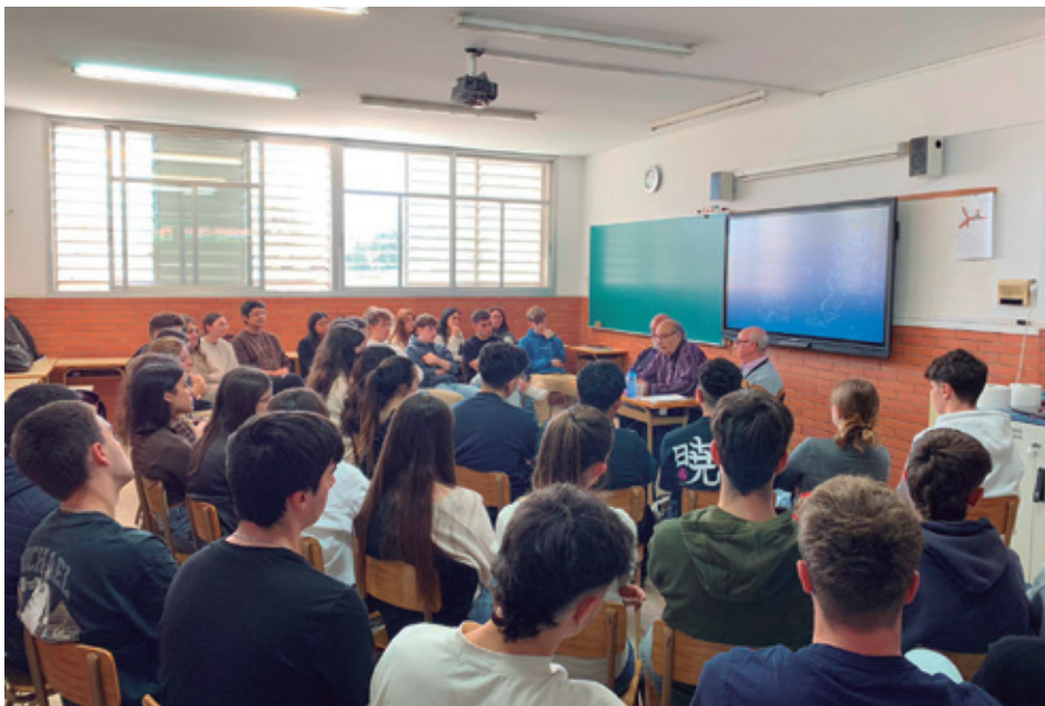
MEMBRES DE LA COMISSIÓ EXPLICANT EL PROJECTE "MATARÓ ANYS 40" EN UNA ESCOLA

Les sessions combinen el relat de testimonis personals amb el suport d'un audiovisual que ajuda a contextualitzar l'època i a apropar-la a l'alumnat d'una manera més visual i entenedora. D'aquesta manera, els joves poden conèixer de primera mà experiències de vida quotidiana, costums, canvis socials i situacions històriques viscudes a la ciutat. Aquest projecte afavoreix el diàleg intergeneracional i permet mantenir viva la memòria col·lectiva, tot fomentant la reflexió dels estudiants sobre el passat i la seva relació amb el present.