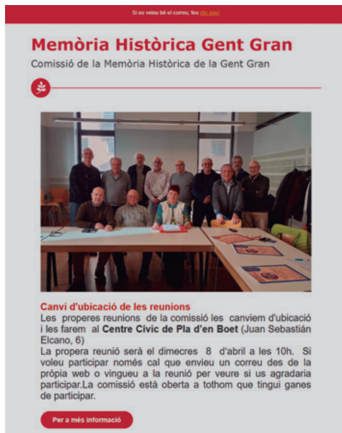
PORTADA BUTLLETÍ DE LA COMISSIÓ

D'aquesta manera, el butlletí i la web permeten preservar i compartir la memòria històrica, fer-la accessible a tothom i assegurar la difusió continuada.