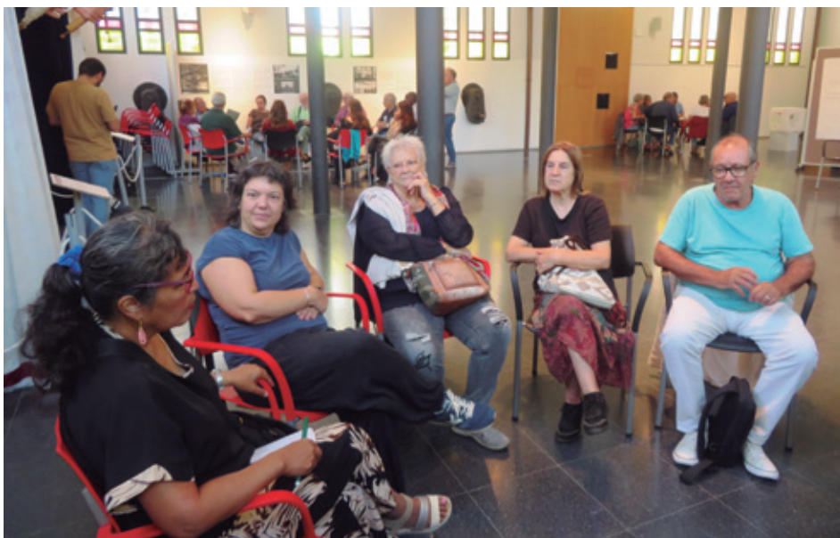
ACTIVATAT "BIBLIOTECA HUMANA" SOBRE PACO CANDEL / AUTORA: JOANNA LIGOS

Paral·lelament, també hem donat suport a altres activitats de la ciutat vinculades a la memòria històrica. Això inclou, per exemple, la revisió i la identificació de fotografies antigues, l'ajuda en la recerca d'informació i la col·laboració amb l'Arxiu per completar dades o contextualitzar documents. Aquest treball ajuda a reconstruir fragments de la història local que sovint no estan documentats de manera completa.