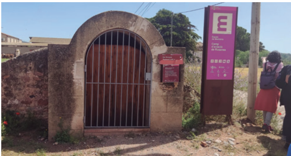
SORTIDA AL CAMP D'AVIACIÓ DE ROSANES

També hem organitzat sortides a espais de memòria històrica, com Corbera d'Ebre, la Maternitat d'Elna, els espais de la Batalla de l'Ebre o el camp d'aviació de Rosanes. Aquestes visites permeten conèixer sobre el terreny els fets històrics, aprofundir-hi i connectar directament amb els llocs on van passar, i afavorir així una experiència d'aprenentatge més vivencial i reflexiva.