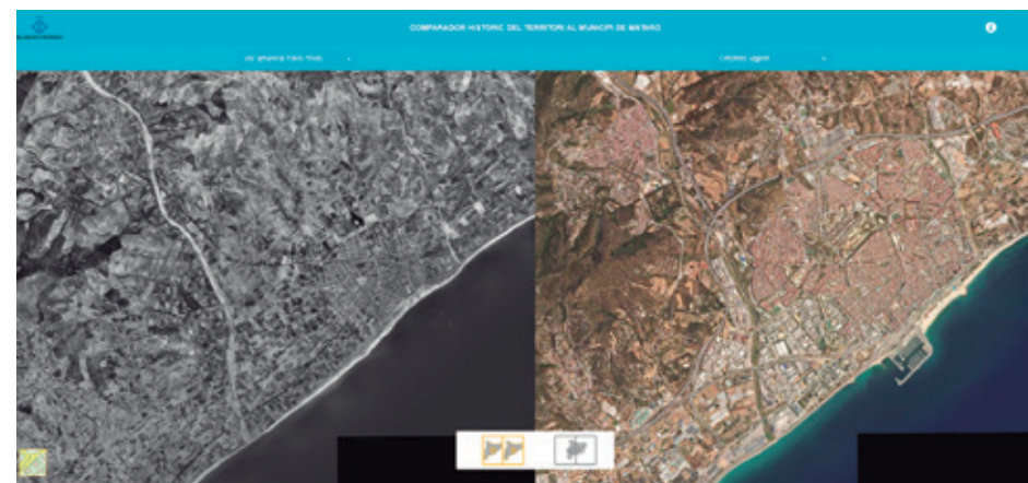
MATARÓ D'AHIR I D'AVUI

Tot plegat demostra que la Comissió segueix activa i amb voluntat de créixer, generant noves propostes per continuar recuperant, preservant i difonent la memòria històrica de la ciutat.