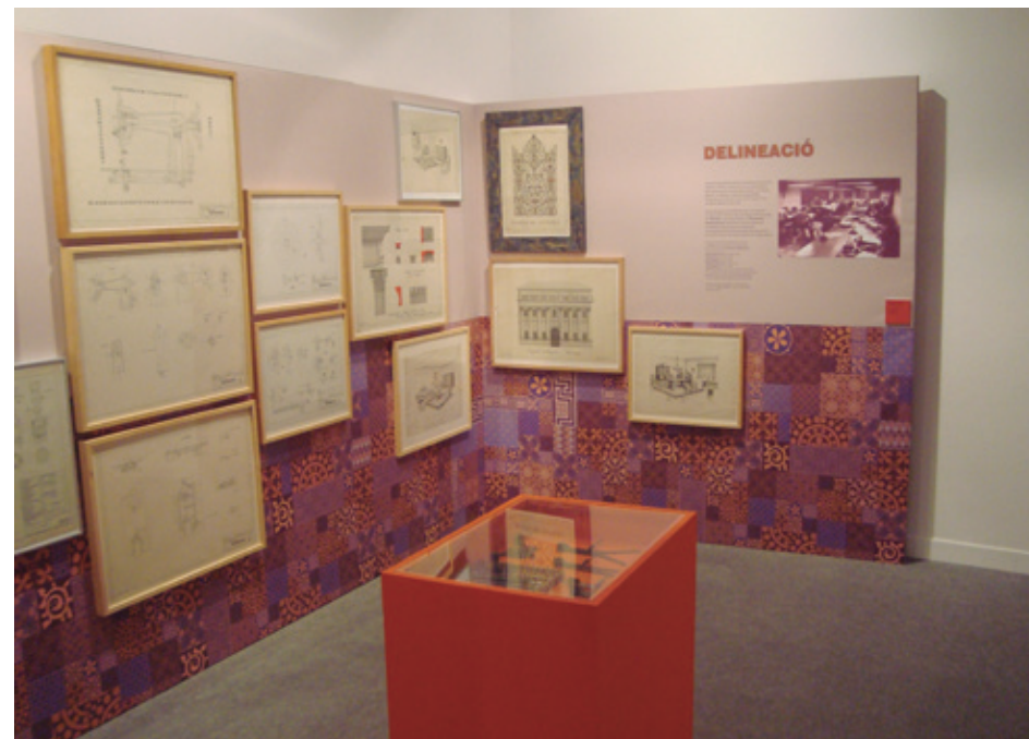
L'EXPOSICIÓ AL MUSEU DE CAN SERRA

L'escola no només proporcionava coneixements tècnics, sinó que també contribuïa a millorar les oportunitats laborals i a impulsar la innovació i la qualitat en els oficis locals. Va ser, per tant, un espai clau per al desenvolupament econòmic, cultural i social de la ciutat. L'exposició, realitzada al Museu de Mataró, va permetre recuperar aquesta memòria i posar en valor la seva importància històrica.