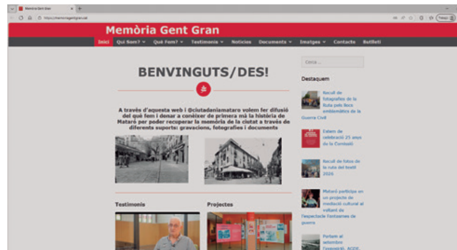
PORTADA DE LA WEB MEMORIAGENTGRAN.CAT

En definitiva, memoriagentgran.cat és un espai de difusió i preservació que reforça el compromís de la comissió amb la memòria històrica i amb la transmissió del patrimoni immaterial de la ciutat a les noves generacions.