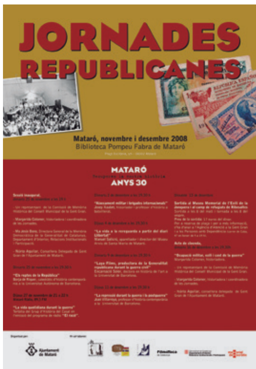
IMATGE DEL CARTELL DE LES JORNADES REPUBLICANES

Aquesta iniciativa va representar una experiència molt enriquidora de recuperació i difusió de la memòria col·lectiva, destacant el paper de la història local i la importància de mantenir viu el record dels fets per construir una societat més conscient i democràtica.