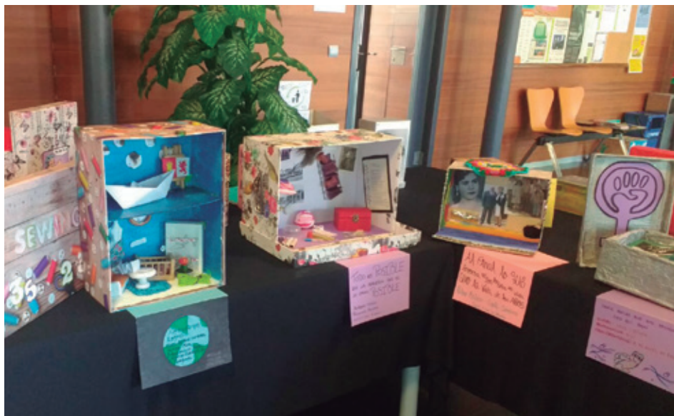
MOSTRA DE DIVERSES CAIXES DE VIDA

A més, hem desenvolupat activitats intergeneracionals amb aquest projecte, posant en contacte gent gran i joves. Aquestes trobades han facilitat l'intercanvi d'experiències, el diàleg entre generacions i la transmissió de la memòria històrica d'una manera propera i participativa.