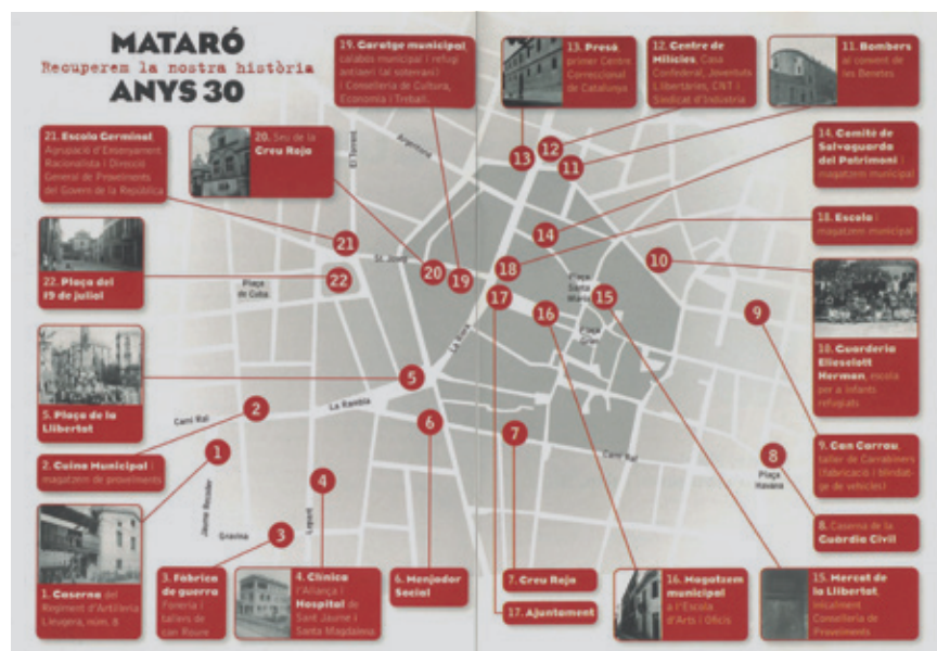
MAPA DELS RECORREGUTS EMBLEMÀTICS DE LA GUERRA CIVIL

El llibret permet que qualsevol persona pugui conèixer el contingut de la ruta, encara que no hi hagi participat, i esdevé una eina de divulgació de la memòria històrica de la ciutat.