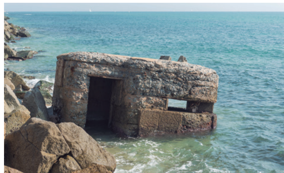
FOTO DEL FORTÍ UBICAT ABANS DE LA ROTONDA DE LA N-II AMB LA RIERA DE MATA

Amb el temps, aquesta ruta s'ha reconvertit en la Ruta de la Pau , mantenint el recorregut pels fortins però se n'ha ampliant el significat per abordar temes actuals com els discursos d'odi, la convivència i el respecte. D'aquesta manera, el passat esdevé una eina per reflexionar sobre el present i fomentar valors de diàleg i cohesió social.