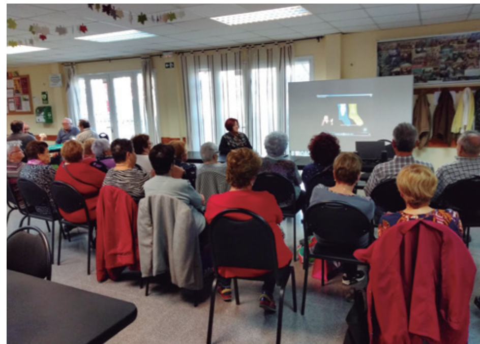
CINEFÒRUM AL CASAL MUNICIPAL DE LA GENT GRAN DE MOLINS

A més, la Comissió també ha participat en el Consell Municipal de la Gent Gran, col·laborant en la proposta i impuls d'iniciatives que fomenten la participació, la cultura i l'intercanvi intergeneracional. Aquestes accions permeten apropar la memòria històrica a la ciutadania i reforçar els vincles entre generacions.