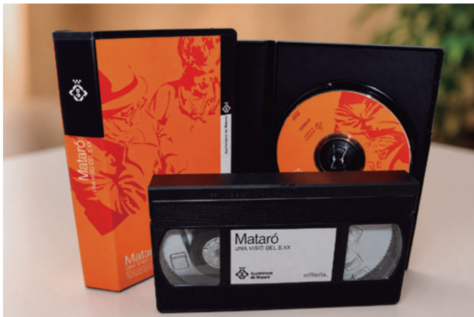
VÍDEO "MATARÓ UNA VISIÓ DEL SEGLE XX"

Més endavant, juntament amb l'Escola Politècnica de Mataró, es van elaborar dos DVD amb el títol -Mataró recuperem la nostra història. Anys 30- . Aquest material recull els principals fets històrics a la ciutat del 1931 al 1939, explicats també per protagonistes del dia a dia, fet que permet oferir una visió més propera i vivencial de la història relatada.