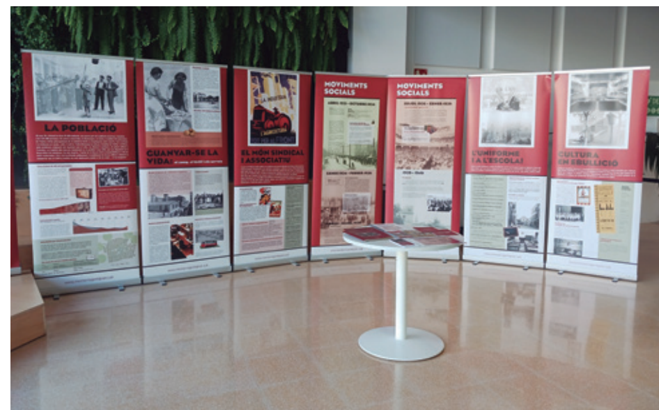
PLAFONS DE L'EXPOSICIÓ "MATARÓ ANYS 30"