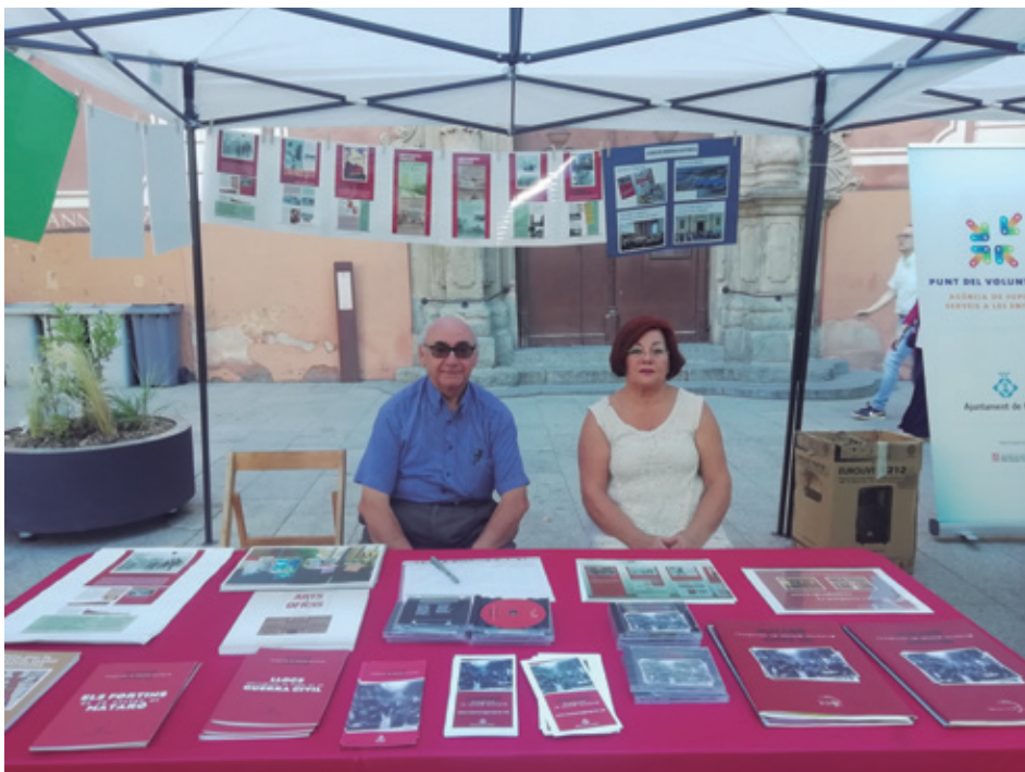
PARTICIPACIÓ A LA MOSTRA D'ENTITATS DE MATARÓ

En conjunt, la mostra ajuda a reforçar el teixit associatiu de la ciutat i a fer créixer la col·laboració entre entitats.