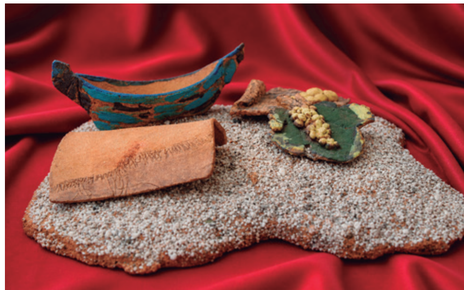
Obra artística realitzada per JOSEFA JAIME en record als membres de la Comissió. L'obra representa el mar, la pesca, la vinya i les patates, elements típics del Mataró del passat.

També es ret homenatge a espais emblemàtics de la ciutat, com fàbriques i indrets que ja no existeixen però que van tenir un paper important en la vida econòmica i social de Mataró. A través d'aquests reconeixements, es recupera la seva història i es manté viu el seu record. Aquestes activitats tenen un fort valor simbòlic i emocional, ja que permeten fer present el passat, dignificar les experiències viscudes i transmetre a les noves generacions la importància de no oblidar la història.