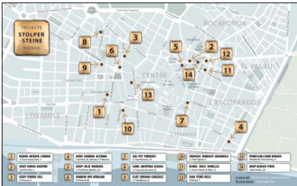
Mapa de les 14 Stolpersteine de Mataró. Disseny: Jordi Lopez Vila.