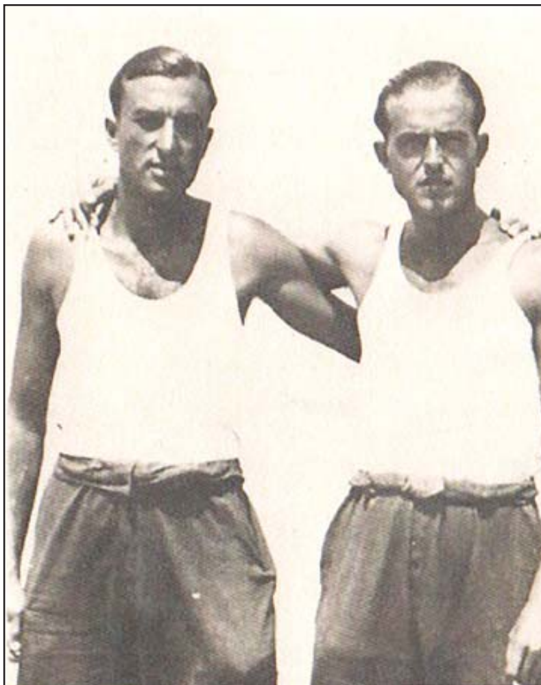
Joaquim Mir –el de l'esquerra– l'any 1939.