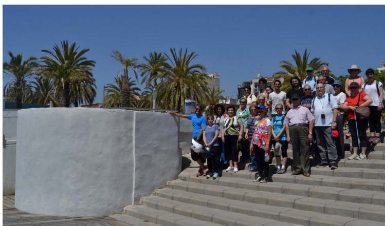
Ruta dels fortins amb el fortí núm 1: 24/05/2017

El 24 de maig de 2017 es va fer la sortida amb visita guiada pels membres de la comissió pels diferents fortins de Mataró.