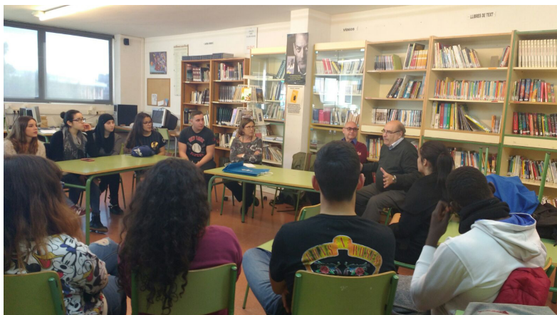
Foto de testimonis a l'IES Laia l'Arquera

Es van fer als centres educatius, les persones grans s'hi van desplaçar. A aquestes trobades, i sempre que en tinguin disponibilitat, comptem amb homes i dones per anar-hi per tal de veure com des de la perspectiva de gènere s'han viscut els diferents aconteixements.